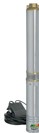
SCM 100-10 HL

P1 1300 watt Q max. 110 l/min H max. 58 m